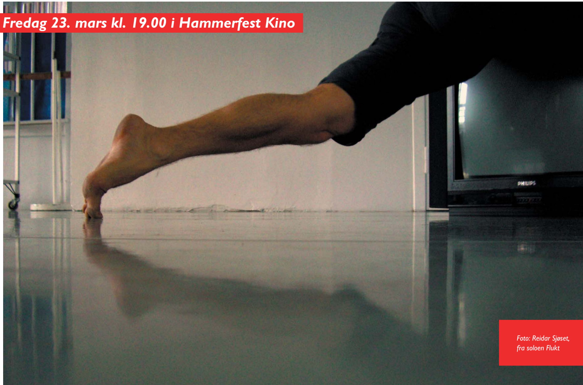
fra soloen Flukt

Fredag 23. mars kl. 19.00 i Hammerfest Kino