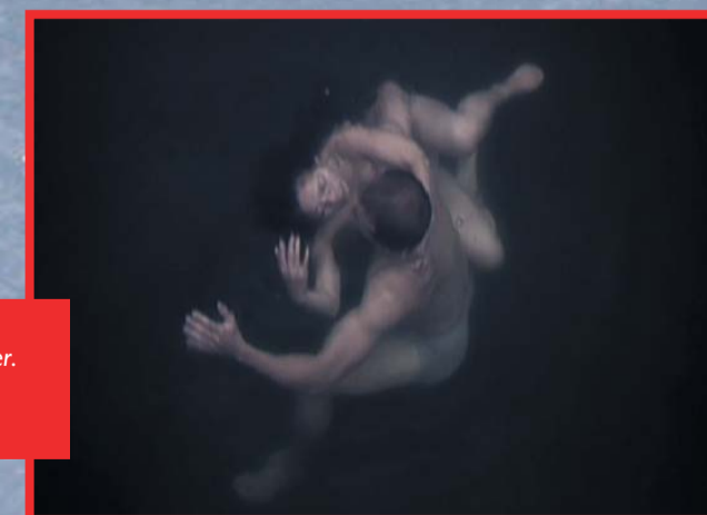
Fra filmen Veien ut av Lise Eger.

Lørdag 24. mars kl. 20.30 ved fontenen ved rådhuset